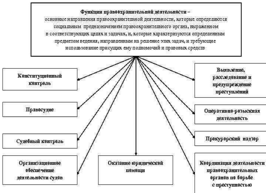
Рисунок 1 – Функции правоохранительной деятельности