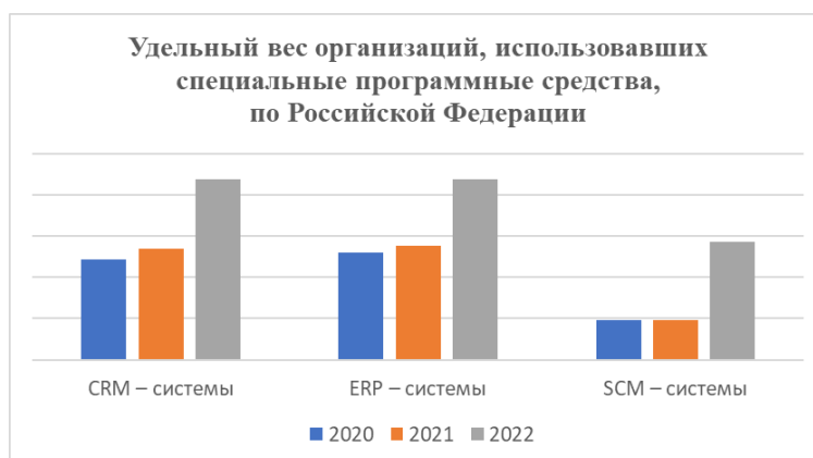
Рисунок 4 - Удельный вес организаций, использовавших специальные программные средства, по РФ в период с 2020 по 2022 год

На рисунке 4 представлен удельный вес организаций, использовавших специальные программные средства, по Российской Федерации в период с 2020 по 2022 год.