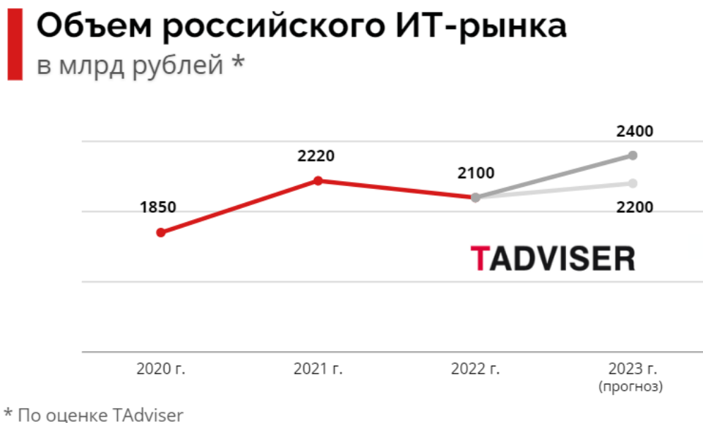
Рисунок 2 – Объем российского рынка - ИКТ

По оценке TAdviser, доходы российских разработчиков ИТ-продуктов - участников ранкинга - в 2022 году выросли на 35%. Компании из сферы