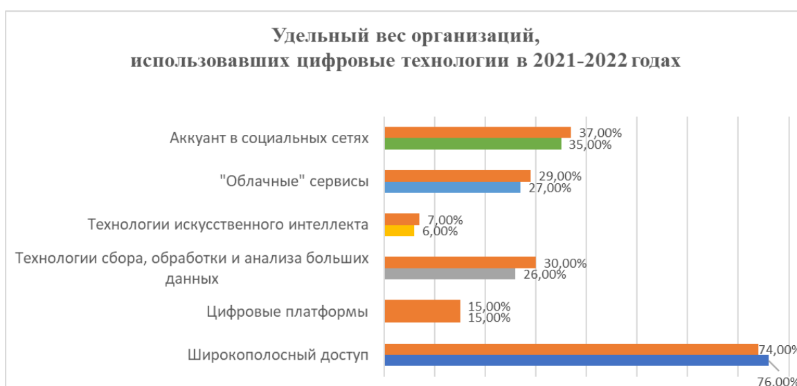
Рисунок 3 - Удельный вес организаций, использовавших цифровые технологии, по РФ в 2021-2022 году

О влиянии цифровых технологий на уровень цифровизации экономики можно судить по данным официальной статистики. На рисунке 3 представлен удельный вес организаций, использовавших цифровые технологии, по Российской Федерации в 2021-2022 годах.