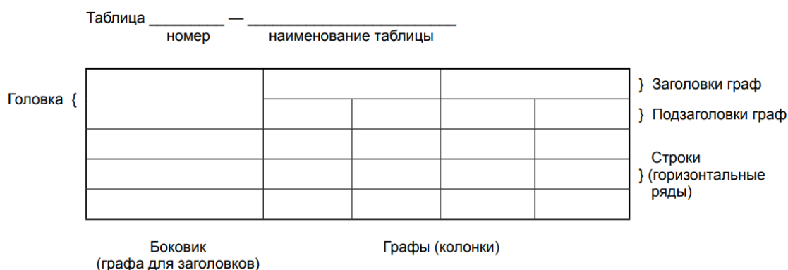
Рисунок 1 – Оформление таблицы

При делении таблицы на части допускается ее головку или боковик заменять соответственно номерами граф и строк. При этом нумеруют арабскими цифрами графы и (или) строки первой части таблицы. Таблица оформляется в соответствии с рисунком 1.