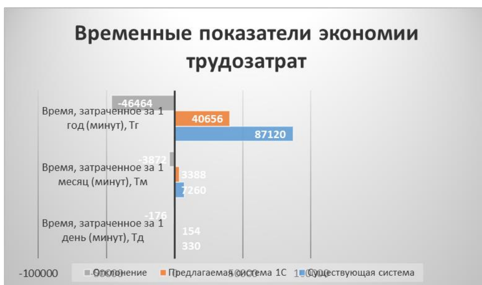
Рисунок 1 - Временные показатели экономии трудозатрат

На рисунке 1 графически изображена экономия трудозатрат.