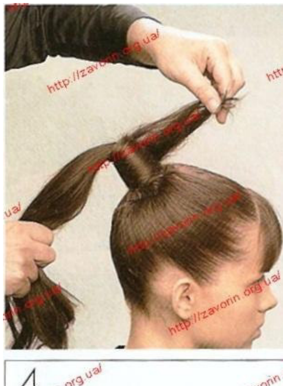
Рисунок 1 – Технологический процесс