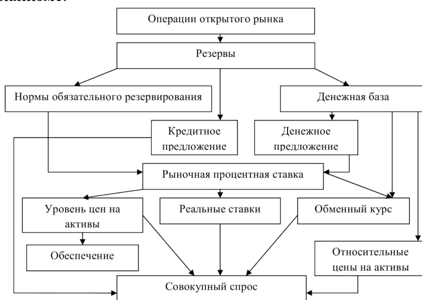
Рис. 1.2 – Схема работы процентного канала в трансмиссионном механизме

На рис. 1.2 представлена схема работы процентного канала в трансмиссионном механизме.