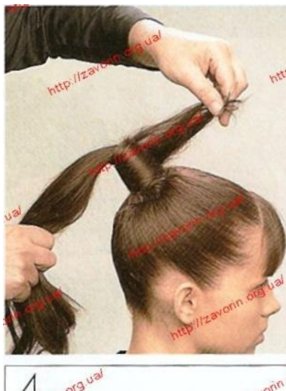
Рисунок 1 – Технологический процесс