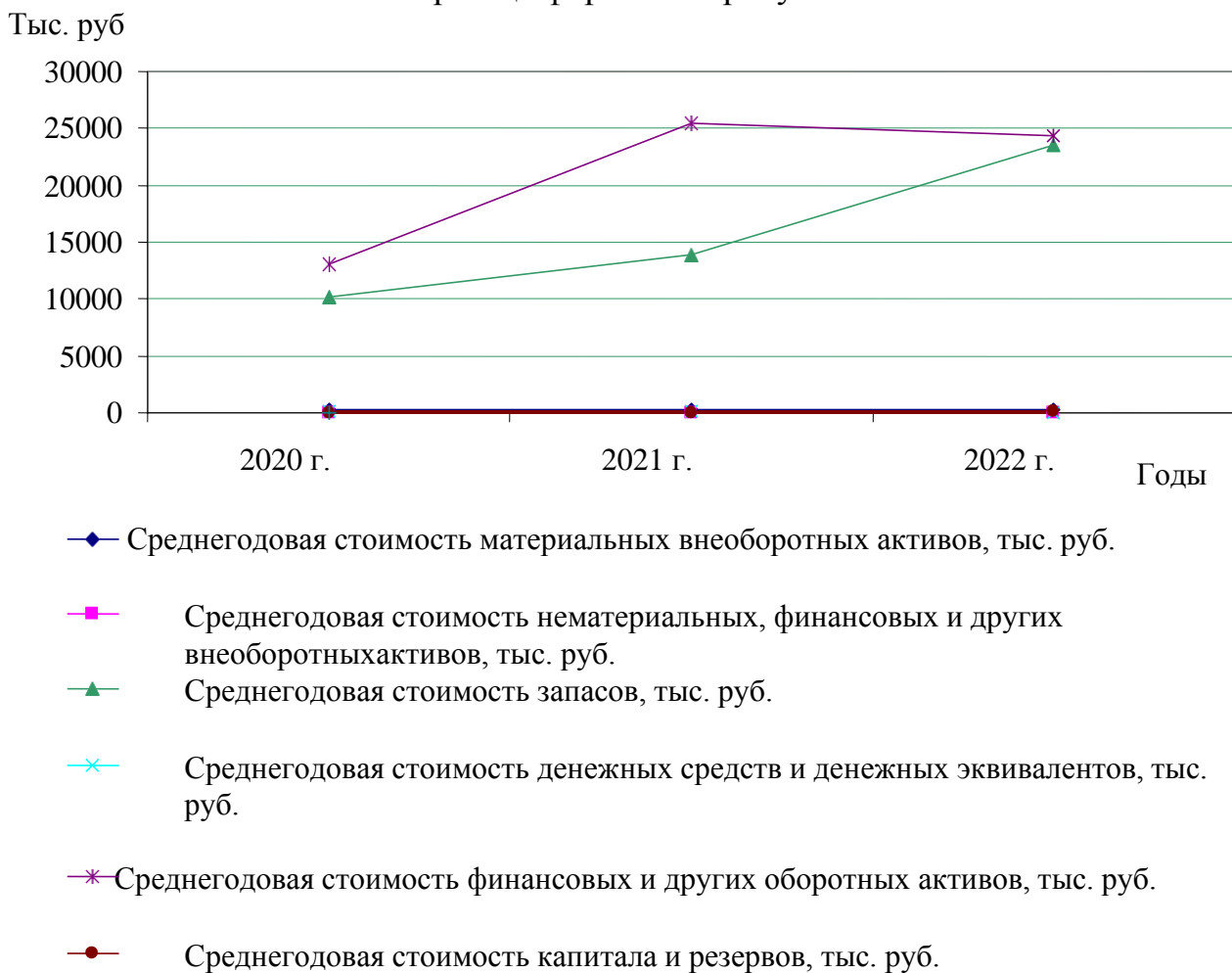
Рисунок 2.2 – Динамика среднегодовых показателей деятельности ООО «ЮГкабель»